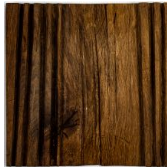
18/8/21 35x35x5 Holz/Eiche