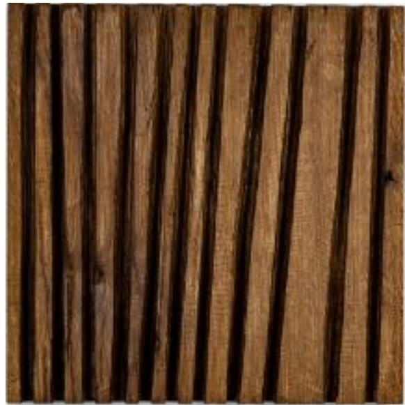
1/9/21 34,5x34,5x5 Holz/Eiche