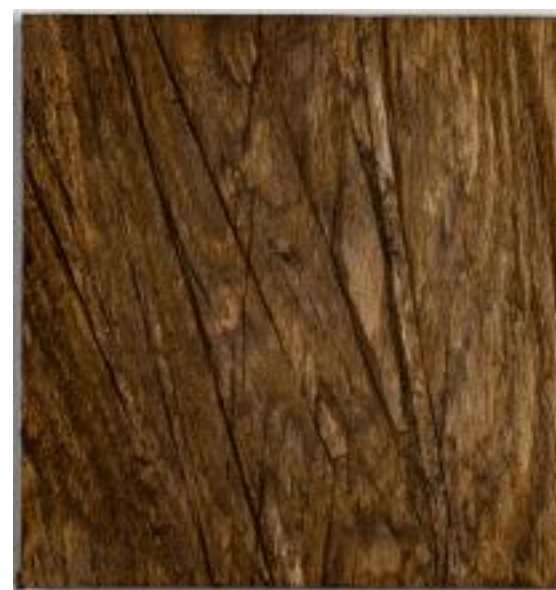
27/3/21 18x18x5 Holz/Eiche