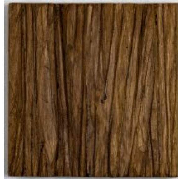
1 /4/21 18x18x5 Holz/Eiche