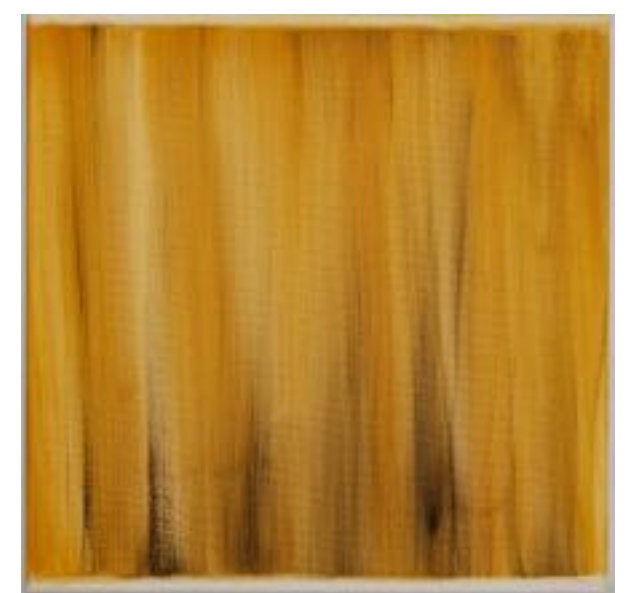
11/9/21 40x40x4 Acryl/Leinwand