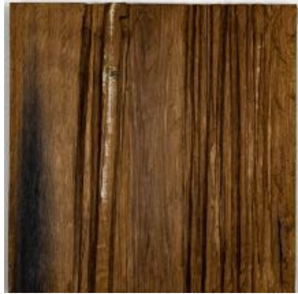
22/5/21 35x23x4 Holz/Eiche