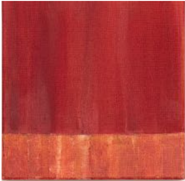
26/9/21 20x20x4 Leinwand