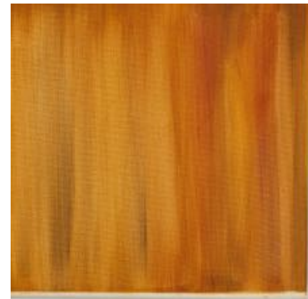
11/9/21 40x40x4 Acryl/Leinwand