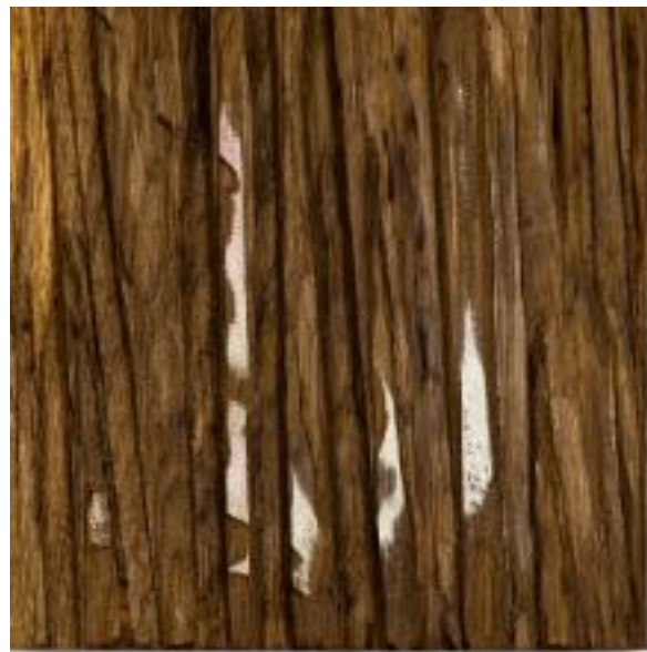
31/3/21 18x18x5 Holz/Eiche