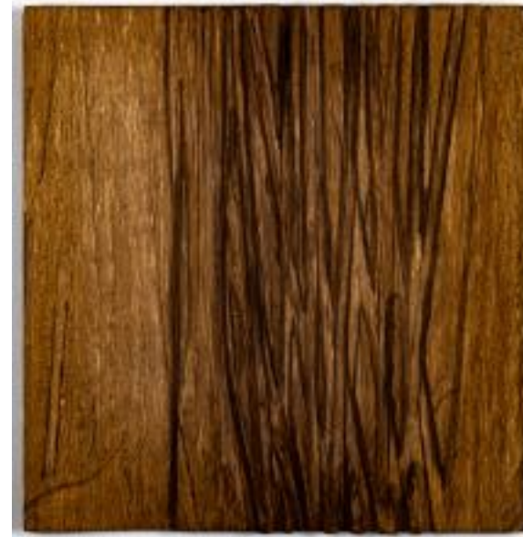
21/5/21 305x35x5 Holz/Eiche