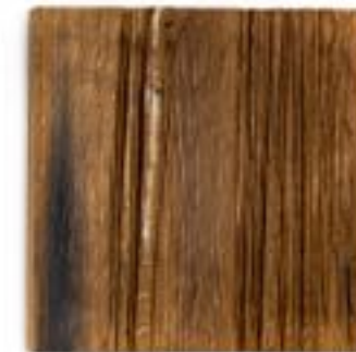
22/5/21 35x35x5 Holz/Eiche