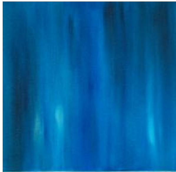
8/9/21 40x40x4 Acryl/Leinwand