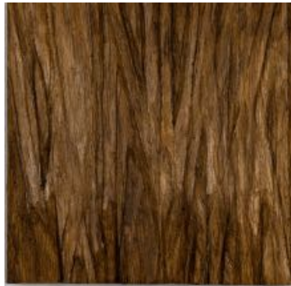
29/3/21 18x18x5 Holz/Eiche