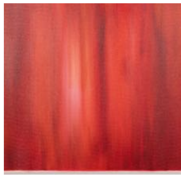
5/9/21 70x70x4 Acryl/Leinwand