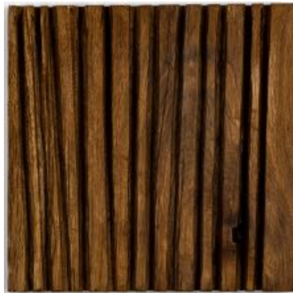
30/8/21 35x35x5 Holz/Eiche