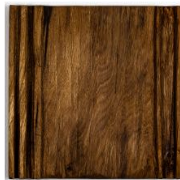
17/8/21 - 35x35x5 Holz/Eiche