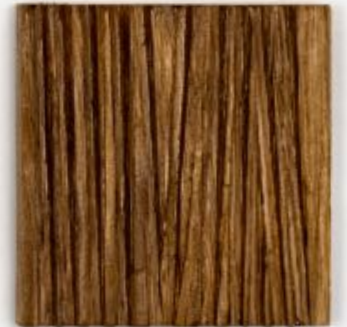
30/3/21 18x18x3,5 Holz/Eiche