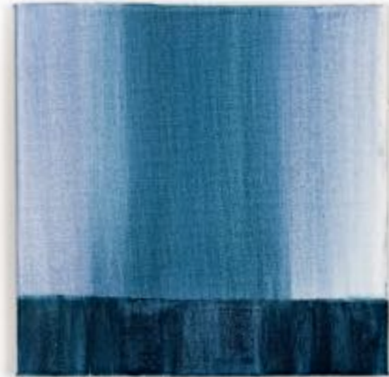
25/9/21 20x20x4 Acryl/Leinwand