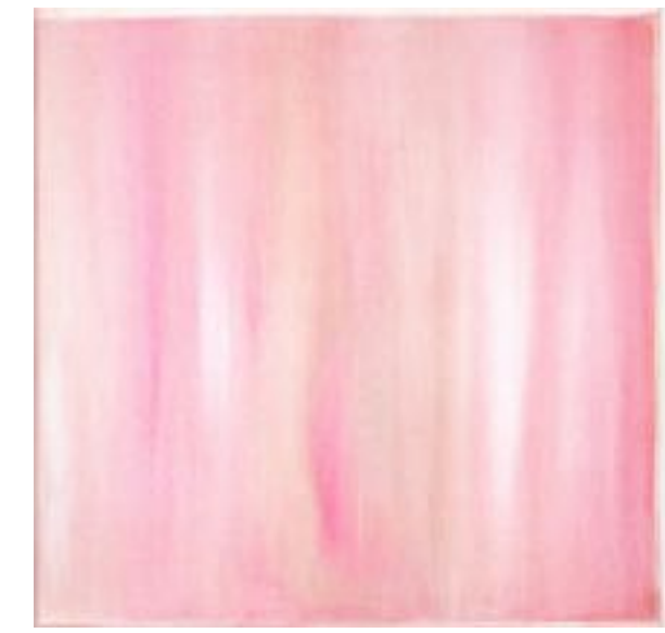
9/9/21 40x40x4 Acryl/Leinwand