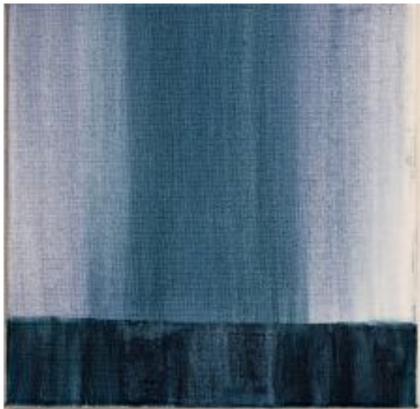
25/9/21 20x20x4 Acryl/Leinwand