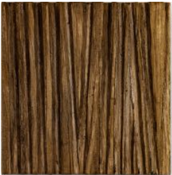
7/4/21 18x18x5 Holz/Eiche