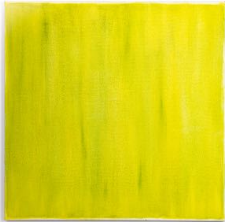
6/9/21 70x70x4 Acryl/Leinwand