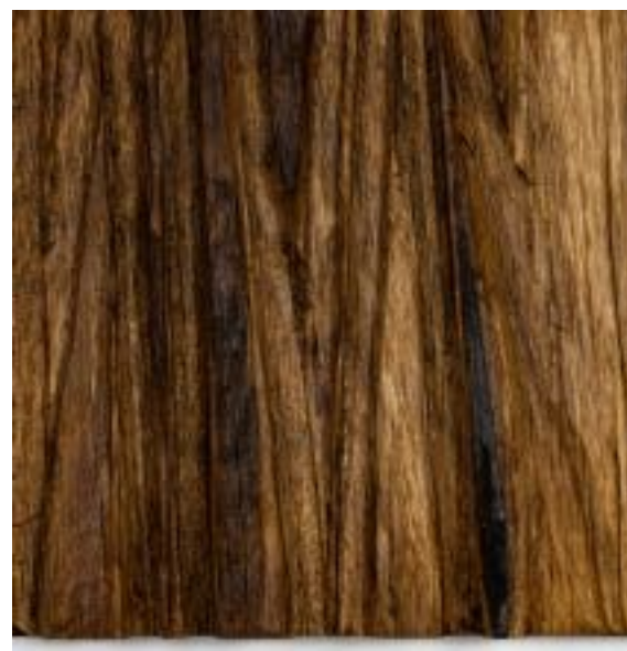
30/3/21 18x18x4 Holz/Eiche