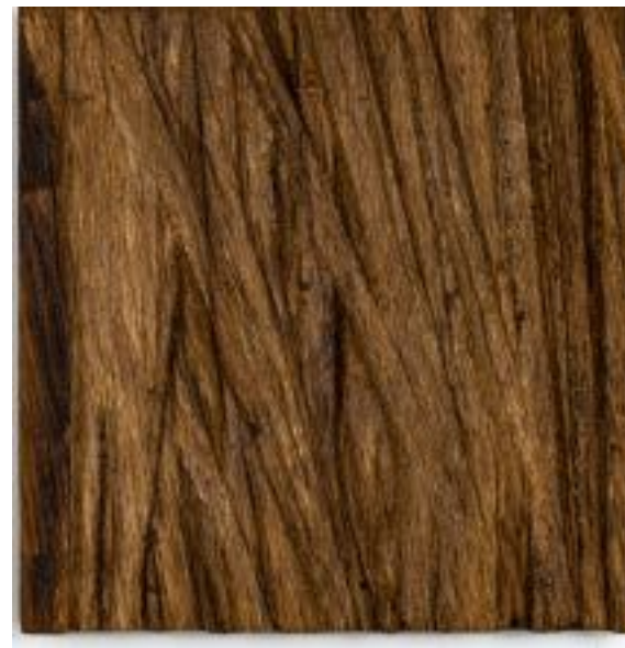
26/3/21 18x18x6 Holz/Eiche