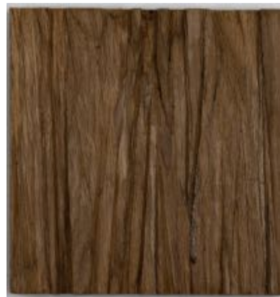
30/3/21 18x18x5 Holz/Eiche