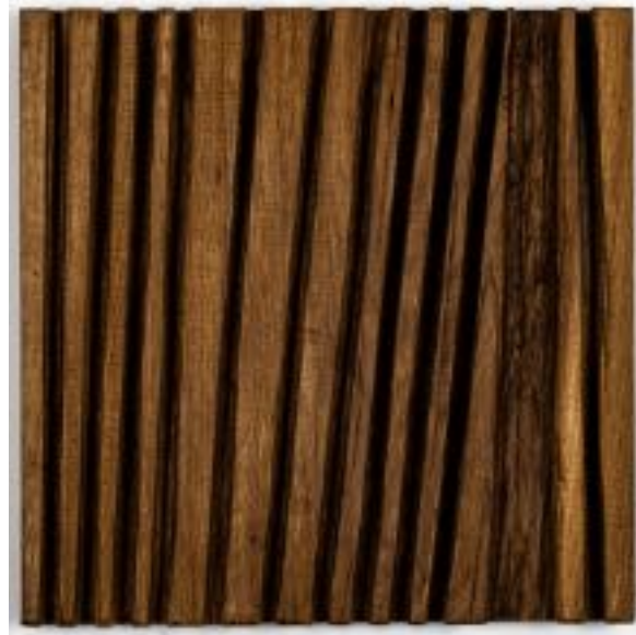
31/8/21 35x35x5 Holz/Eiche