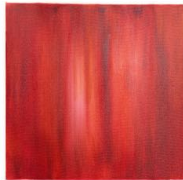
5/9/21 70x70x4 Acryl/Leinwand