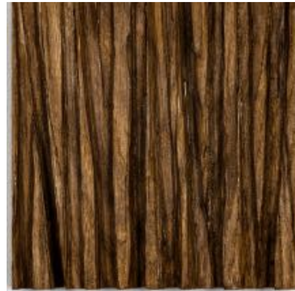
17/8/21 - 35x35x5 Holz/Eiche