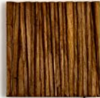
29/3/21 18x18x4 Holz/Eiche