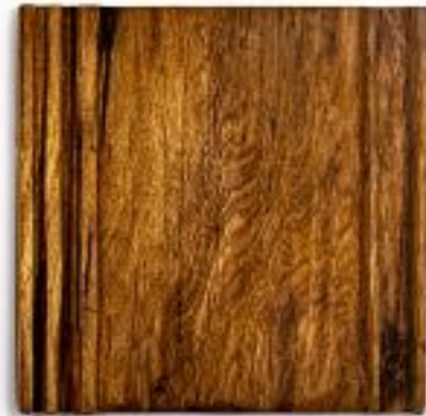
17/8/21 35x35x5 Holz/Eiche