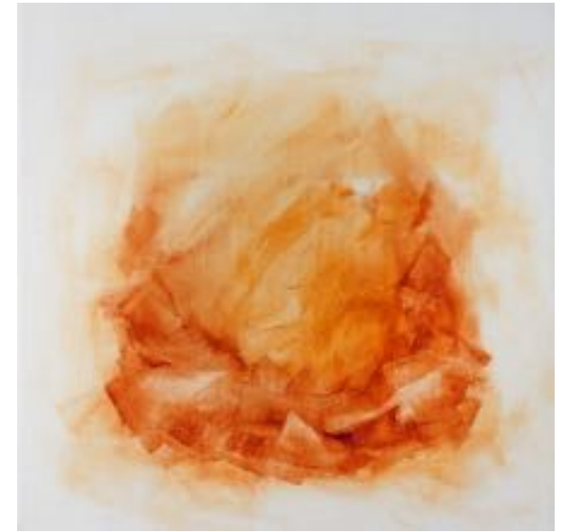
19/10/21 40x40x4 Acryl/Leinwand