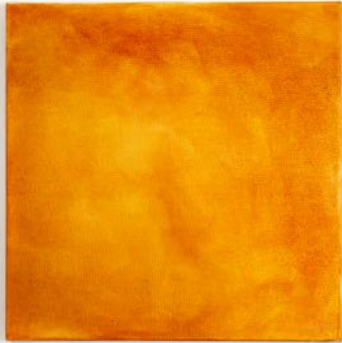
20/9/21 40x40x4 Acryl/Leinwand