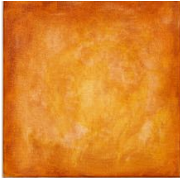
21/9/21 40x40x4 Acryl/Leinwand