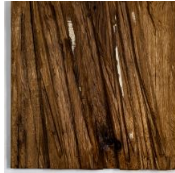
17/5/21 35x35x5 Holz/Eiche