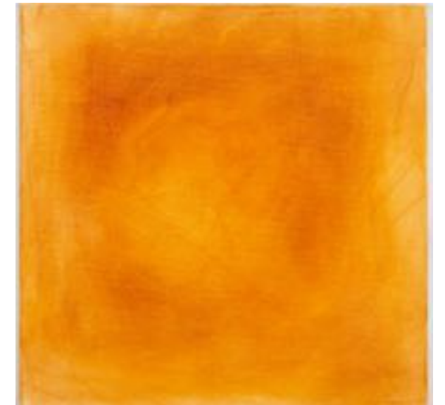
19/9/21 40x40x4 Acryl/Leinwand