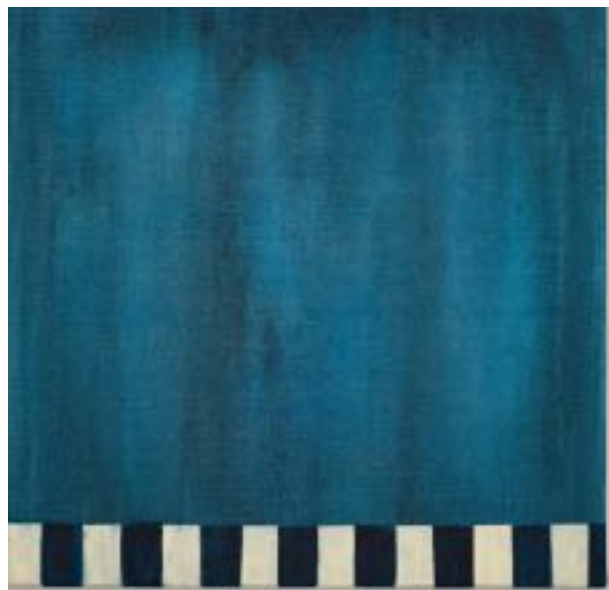
22/9/21 40x40x4 Acryl/Leinwand