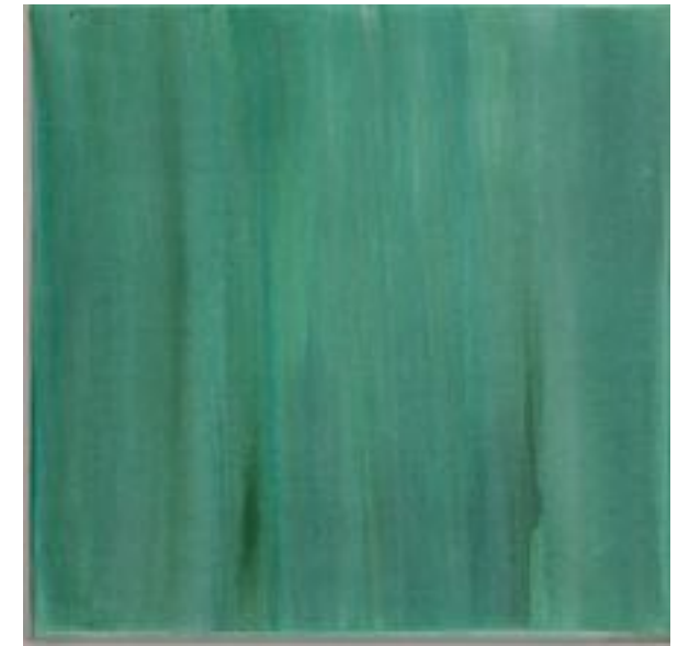
7/9/21 40x40x4 Acryl/Leinwand