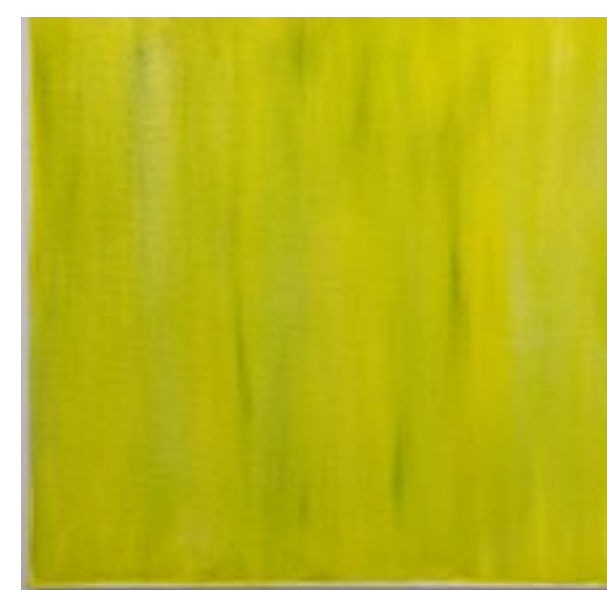
6/9/21 70x70x4 Acryl/Leinwand