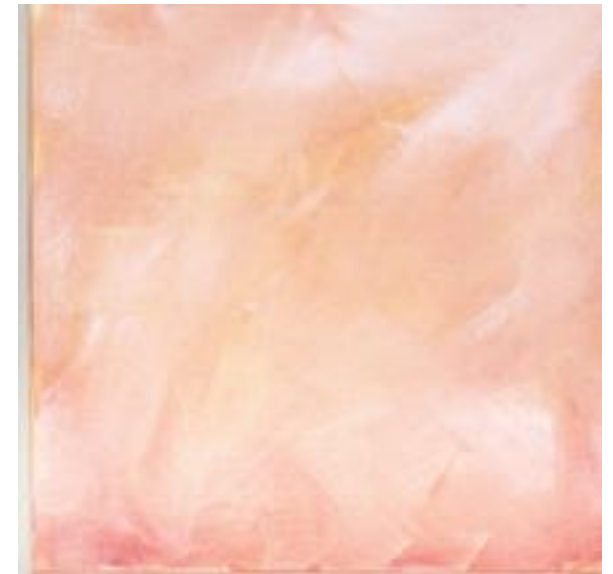
12/9/21 40x40x4 Acryl/Leinwand