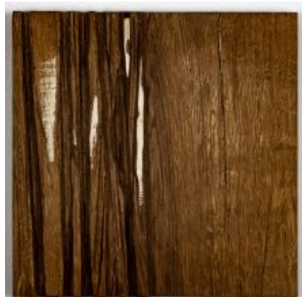
20/5/21 30x30x5 Holz/Eiche