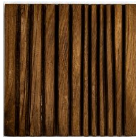
3/9/21 35x35x5 Holz/Eiche