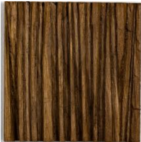
6/4/21 18x18x5 Holz/Eiche