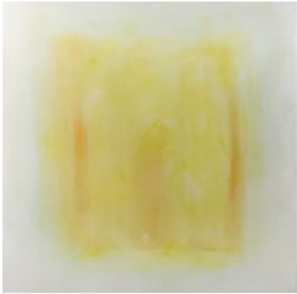
29/9/21 70x70x4 Acryl/Leinwand